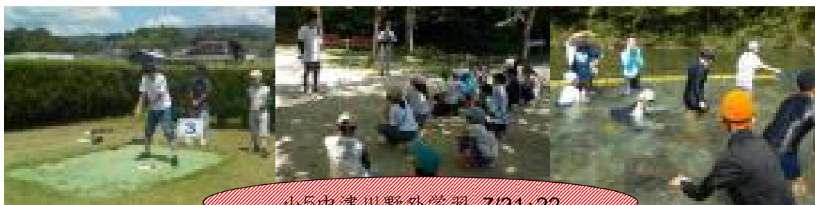
小5中津川野外学習 7/21・22

さて、今日から2学期が始まります。2学期は一年間の中でも一番長く、勉強にも運動にも落ち着いて取り組むことができる時期です。この長い2学期、一日の始まりの朝を大切に、いろいろなことに積極的に取り組んでもらいたいと思います。